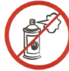
Φιάλες ψεκασμού αερίων