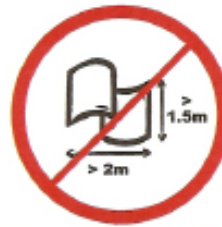
Πανό ή σημαίες μέγιστου μήκους 2μ. X 1,50μ.