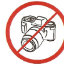
Φωτογραφικές μηχανές, βιντεοκάμερες για επαγγελματικό σκοπό