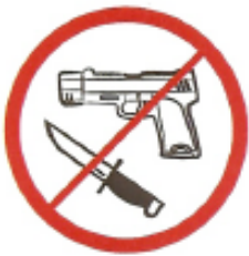
Όπλα κάθε είδους