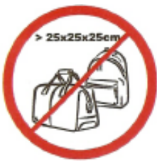
Οποιαδήποτε σακίδια, μεγάλες σακούλες κτλ. μέγιστων διαστάσεων 25εκ. X 25εκ. X 25εκ.