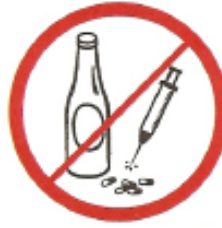
Οινοπνευματώδη ποτά, ναρκωτικά