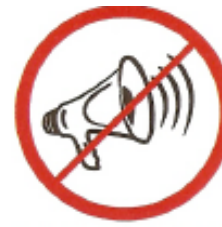
Μηχανικές ή ηλεκτρονικές συσκευές παραγωγή ήχου, όπως τηλεβόες, κόρνες κτλ.