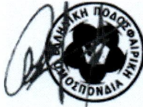
Ιάκωβος Μ. ΦΙΛΙΠΠΟΥΣΗΣ